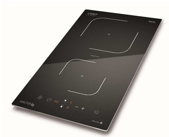
Master E2 Induktion