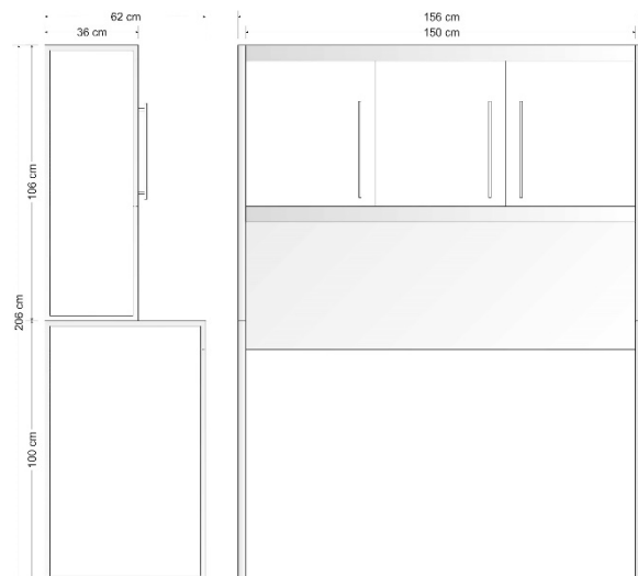
156 cm 117 kg