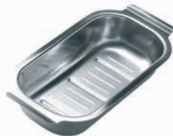
SIEBEINSATZ FÜR SPÜLBECKEN