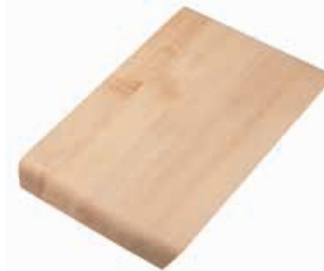
SCHNEIDEBRETT - HOLZ