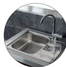
EINBAUSPÜLBECKEN MIT ARMATUR KLAPPBAR